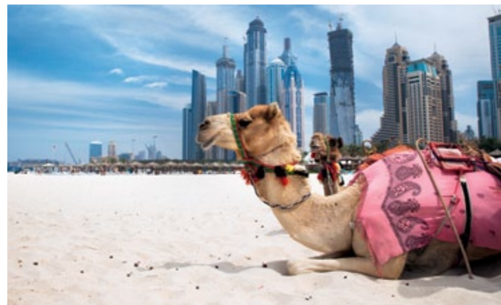
Przejażdżka na wielbłądzie jest często gratisowym dodatkiem do pustynnego safari pod Dubajem

Cztery w jednym – restauracja, plaża z rozstawionymi wygodnymi łózkami, lounge bar i sports bar, w którym na ogromnym ekranie można oglądać mecze i inne wydarzenia sportowe na żywo. Niestety nie jest to tanie miejsce – dania główne (pasty, ryby, grillowane mięso) kosztują 50-110 zł, drinki 30-50 zł. www.barastibeach.com